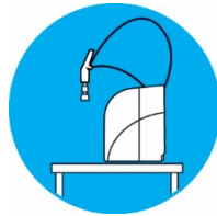
התקנה על קיר לחסכון במקום

TREION™ OmniaTap הינה מערכת מושלמת כאשר נדרשים שני סוגי מים מטופלים, Pure Water ו-UltraPure Water. טכנולוגיות סינון מתקדמות ומשולבות מאפשרות אספקת מים מטופלים בשתי איכויות אלה ממערכת אחת. ניתן להזין את המערכת גם ממי ברז. לחיצה על כפתור הבקרה הדיגיטלי של הדיספנסר מגמיש משחררת נפח מוגדר מראש של UltraPure Water בתקן ASTM I. סחרור Pure Water במיכל מובנה שנפחו 10 ליטר שומר על איכות המים בתקן II ASTM. הדיספנסר כולל יחידת סינון מיקרוני המותאמת לאספקה ישירה של מים סטריליים בנקודת השימוש.