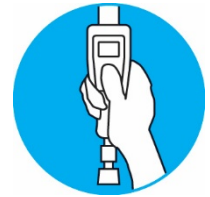
תפעול ביד אחת