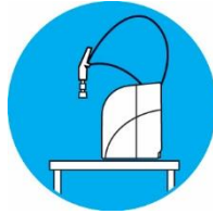
התקנה על קיר לחסכון במקום

TREION™ OmniaTap הינה מערכת מושלמת כאשר נדרשים שני סוגי מים מטופלים, Pure Water ו-UltraPure Water. טכנולוגיות סינון מתקדמות ומשולבות מאפשרות אספקת מים מטופלים בשתי איכויות אלה ממערכת אחת. ניתן להזין את המערכת גם ממי ברז. לחיצה על כפתור הבקרה הדיגיטלי של הדיספנסר הגמיש משחררת נפח מוגדר מראש של UltraPure Water בתקן I ASTM. סחרור Pure Water במיכל מובנה שנפחו 10 ליטר שומר על איכות המים בתקן II ASTM. הדיספנסר כולל יחידת סינון מיקרוני המותאמת לאספקה ישירה של מים סטריליים בנקודת השימוש.