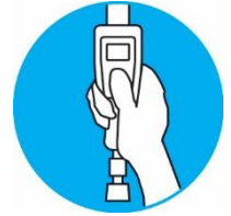
תפעול ביד אחת